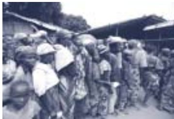
Coda al Centro Nutrizionale