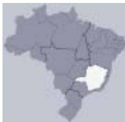
Minas Gerais, Brasile