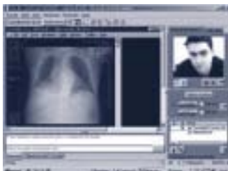
Salute in rete